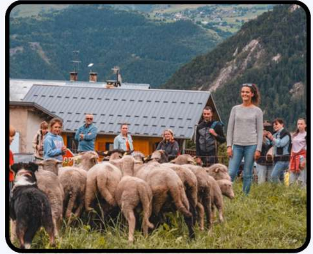
Fête des Rembertins p.5