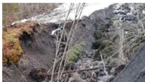
Passage Champlong avant

D'importants dégâts ont lieu lors des fortes intempéries survenues fin d'automne 2023. Plusieurs chemins communaux ont été ravinés voir emportés par des coulées de boue, notamment sur les secteurs du lac de l'Oeillette, le Pont de la Scie, les Pouillères et le passage de Champlong.