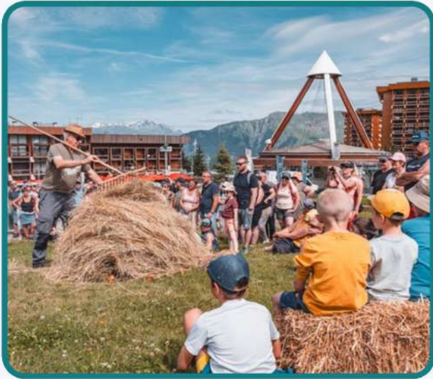
Fête du patrimoine au Corbier p.8