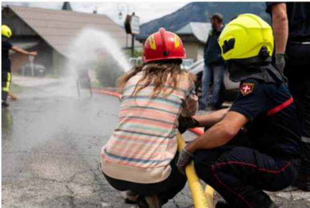
Animation au village de Villarembert le 18 août 2024.

Le centre de secours de montagne du Corbier réalise quant à lui 180 interventions par an sur les communes de Villarembert et Fontcouverte- la Toussuire. En saison d'hiver un effectif de garde composé de 3 à 6 sapeurs-pompiers professionnels et saisonniers est présent 24h/24h. L'effectif à l'année actuel est quant à lui de 9 sapeurs-pompiers volontaires dont 2 nouvelles recrues intégrées en 2024. Cela reste malheureusement insuffisant pour assurer la couverture opérationnelle de ce territoire en intersaison.