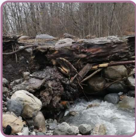
Les intempéries - automne 2023 p.4