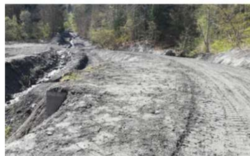
Passage Champlong après

Des buses ont été installées au lac de l'Oeillette afin que l'eau pluviale puisse repartir dans le cours d'eau et les chemins restaurés .