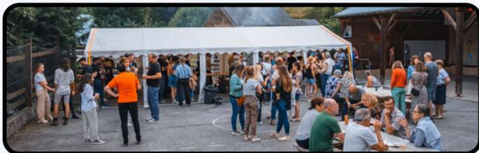
Fête de la musique du 21 juin 2024 p.8