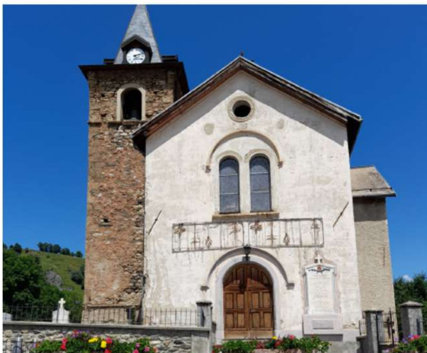
Eglise de Saint-Pierre-aux-Liens à Villarembert

L'appel aux dons s'adresse à tous, particuliers et entreprises souhaitant participer à la réalisation de projets patrimoniaux, mémoriels et historiques. La Fondation du patrimoine fera parvenir à chaque donateur un reçu fiscal.