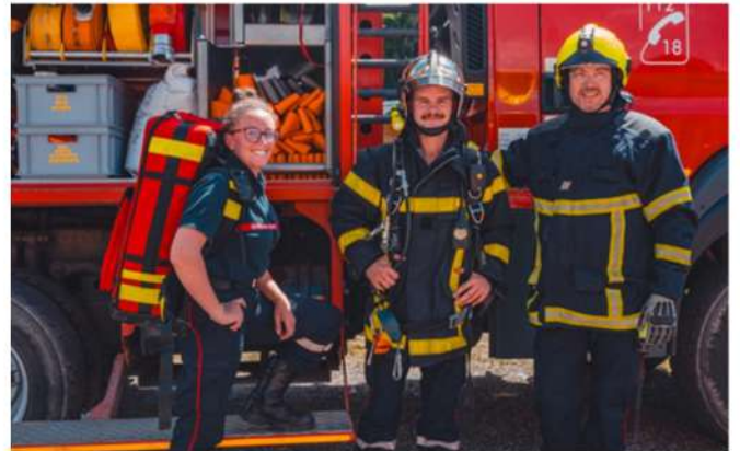
animation lors du 14 juillet 2024 sur le front de neige du Corbier.

C'est à ce titre que nous rappelons que les sapeurs-pompiers du Corbier recrutent et que toutes les personnes intéressées par cette activité peuvent contacter directement le centre d'incendie et de secours au 04.79.59.90.46 ou par mail : compagniemaurienne@sdis73.fr .